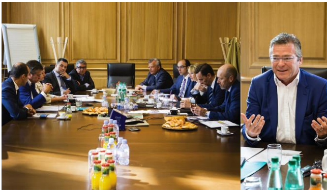
Découvrez le compte-rendu de notre dernière table ronde