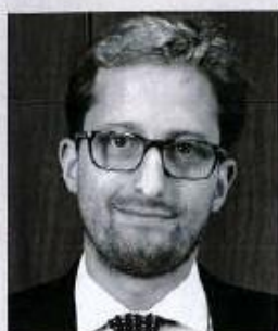
par Serge Prévaille, administrateur judiciaire associé co-gérant